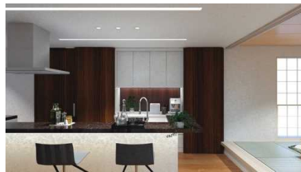
キッチンスタジオ