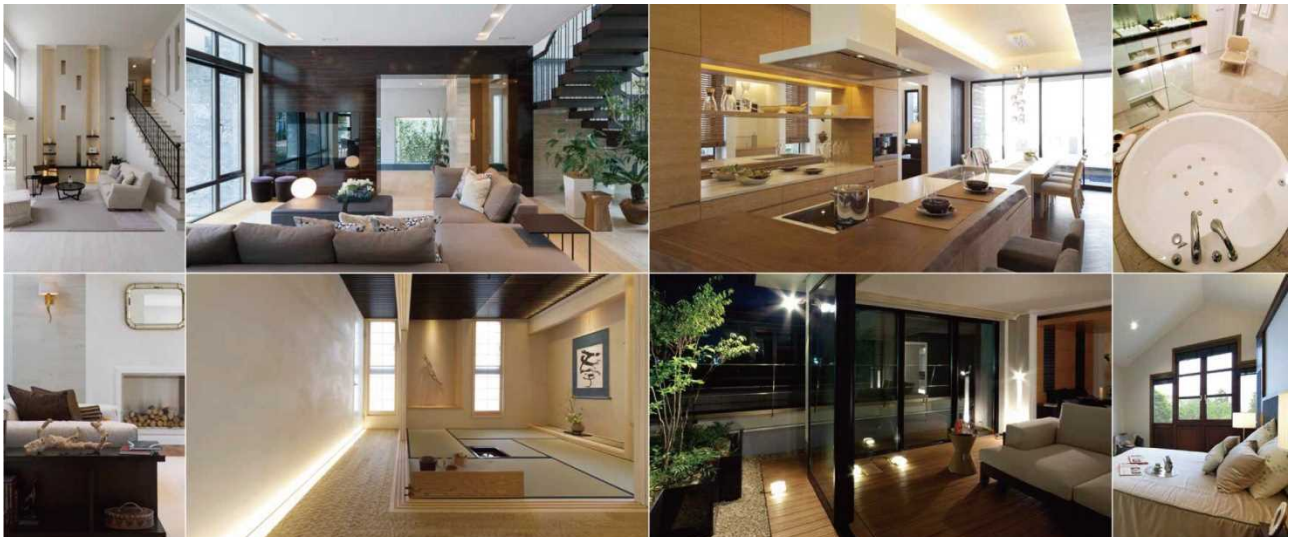
当社各ホームギャラリーの「こだわり」の提案。

三菱地所ホームの自由設計は、すでにある規格プランや商品に当てはめる自由設計ではありません。お客様の想いを伺い、最初のひと筆からお客様だけの住まいを設計します。目指しているのは、できあがるまでの納得感も、できあがった後の満足感も違う住まいです。お客様一人ひとりの「こんな家にしたい」というこだわりをどこまでも応えていきます。