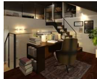
書斎（固定階段付き 2.5 階+ロフト）