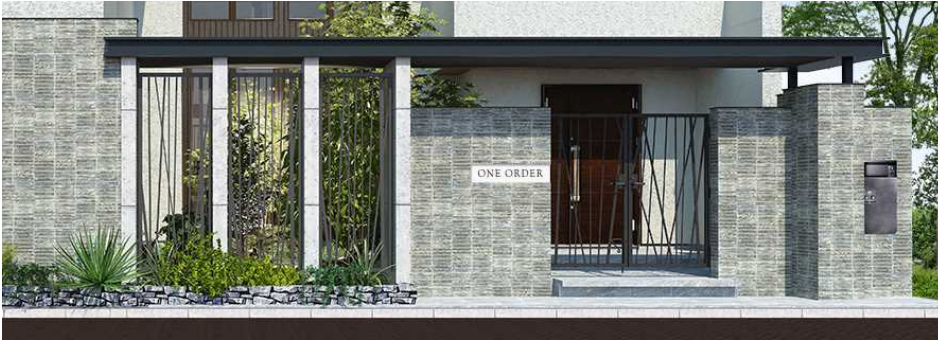
武蔵野ホームギャラリーのエントランスゲート

昔ながらの日本の邸宅には、必ず土壁の塀や立派な門が当たり前に存在し、時間の経過とともに存在の重みを増しながら周辺環境と調和していた。建物本体と外構を含めた建築計画とすることで、未永く住み継がれて街並みのひとつの風景として存在するデザインの一例として提案。