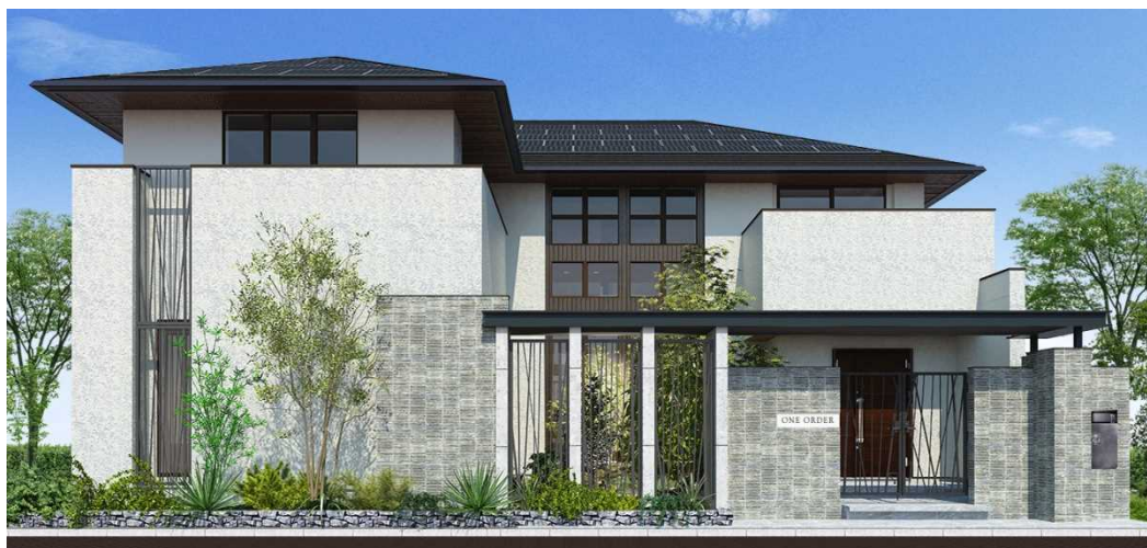
『ONE ORDER』武蔵野ホームギャラリー 外観

今回オープンする『ONE ORDER』最新モデルハウスの武蔵野ホームギャラリーでは日常生活の質を高めるため、家族とつながりながらもきちんとプライベートの時間を過ごし楽しめる、さまざまな“大人の上質な Pastime（趣味）空間”をご提案します。水平ラインを強調させるエントランスゲートと建物を一体とし、外構までを含めた敷地全体でデザインしたファサードに、塗り壁やクラフト調タイル、鋳物の格子など日本らしい風合いの素材を使うことで、周囲と調和しながらも堂々とした風格のある外観となっています。また、インテリアは木造ならではのあたたかい質感が落ち着きのある雰囲気をつくり出し、日本文化が香るオーセンティックなデザインとなっています。