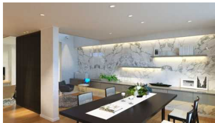
ホームライブラリー & ダイニング