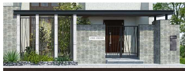
エントランスゲート