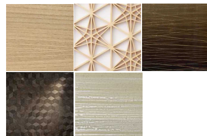
質感豊かな基本素材と和を感じる素材