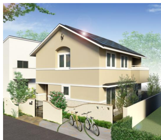
「スマート・エヴァリエ」イメージパース