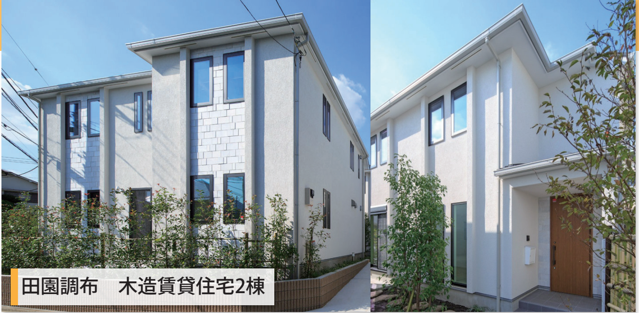
田園調布 木造賃貸住宅2棟