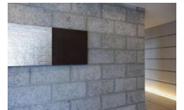
三菱地所ホームホームギャラリー