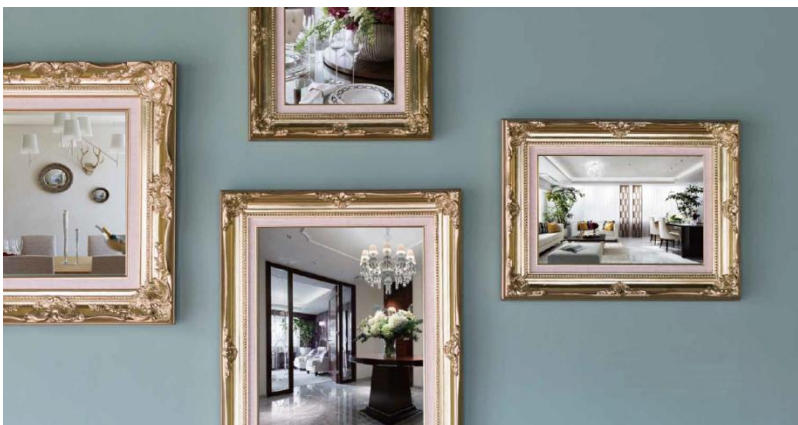
参考写真:ザ・パークハウス グラン 麻布仙台坂、ザ・パークハウス グラン 南青山、三菱地所ホームホームギャラリー

三菱地所のリフォーム「Re Gran」では、経験豊富な専任メンバーが担当します。