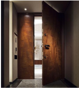
参考写真:ザ・パークハウス グラン 麻布仙台坂

目指したのは五感に共鳴する真のゆとりを極めること。 悠々とした広さの空間に、ライティングやインテリア演出を織り交ぜた高揚感のある空間を設計。 優美で洗練された、人生を満たす私邸をつくり上げます。