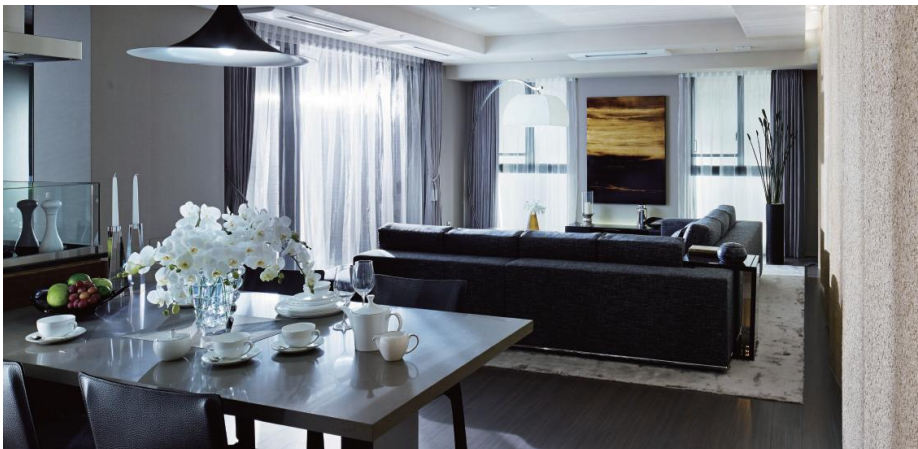
参考写真:ザ・パークハウス グラン 三番町

本物には、時を経ても色褪せることのない美しさがあります。 「最高品質の仕様」は私たちのデザインポリシーのひとつ。 本物を知るお客様のために、世界中から最高級・最高品質の仕様と設備機器を選びすぎります。