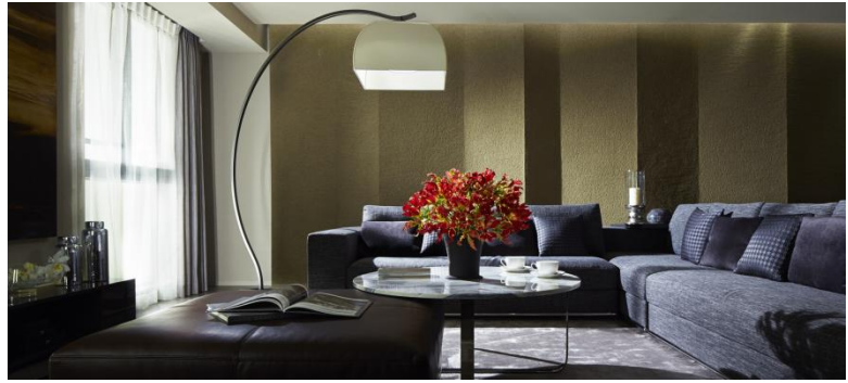
参考写真:ザ・パークハウス グラン 三番町