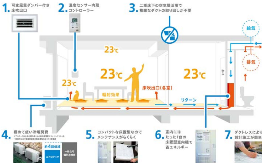
「新マンションエアロテック」概念図

今般、『マンションエアロテック』の更なる普及に向けて、二重床の床下空間で通気を行う『新マンションエアロテック』の実証実験に着手することとなりました。