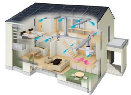
エアロテック概念図