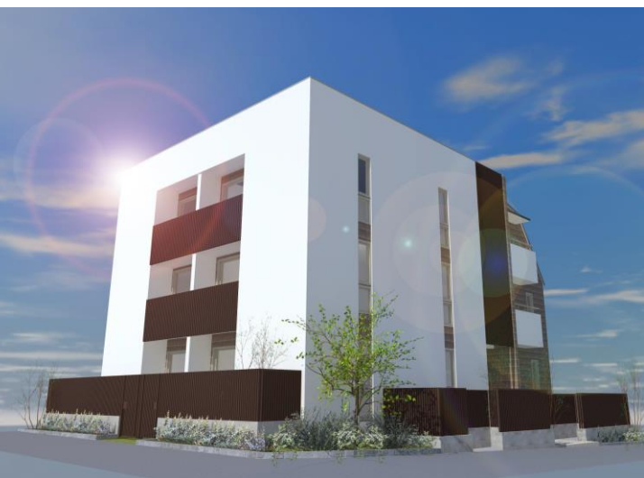
ご提案パース(A棟外観①)