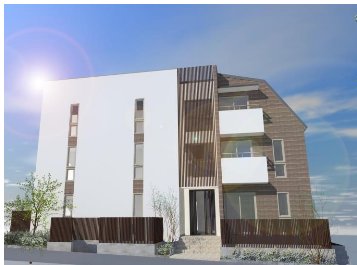
ご提案パース(A棟外観②)