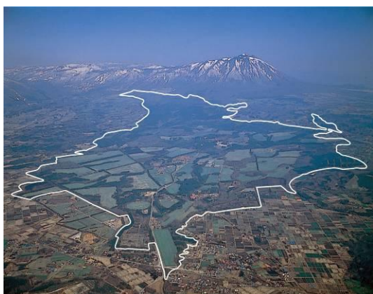
小岩井農場全体空撮

また、明治期より植林、枝打ちや間伐などの撫育作業から伐採収穫まで、山林の生育状況や全ての管理作業が台帳に記録されており、生産履歴が明確な木材であることが小岩井農場産木材の特徴となっています。