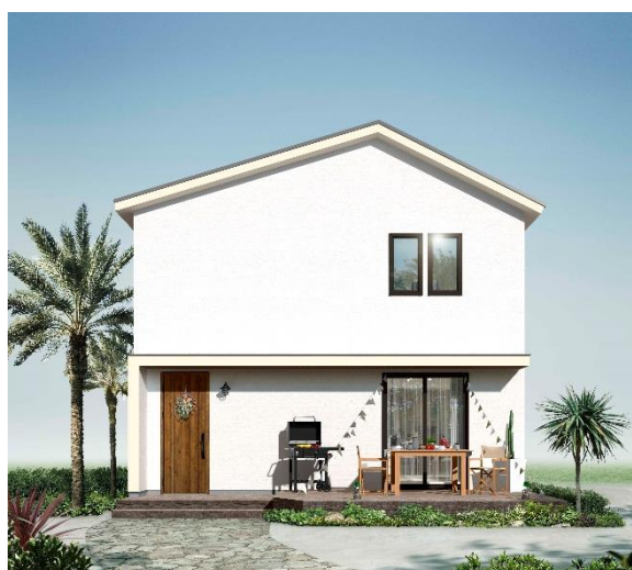
ナチュラルヴィンテージスタイル 外観イメージ

間取りをプランニングし、お好みの世界観をお選びいただくだけで、トータルコーディネートされた住まいが完成。まるで1950年代のアメリカ映画のワンシーンのような世界観の中で、快適に暮らす心地よさをお届けします。